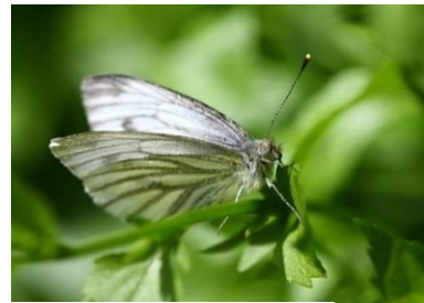
Klein geaderd witje